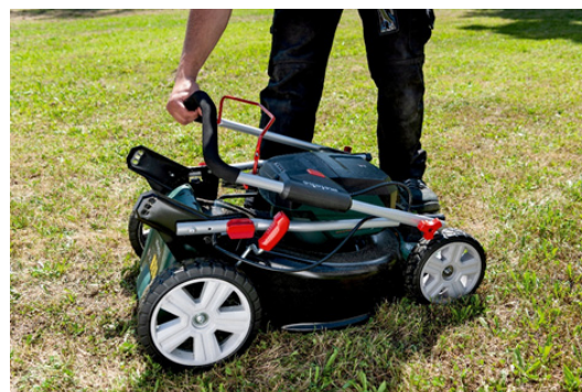
Enorme potência, muito compacto: o RM 36-18 LTX BL 46 pode ser facilmente dobrável para facilidade de transporte e armazenado na vertical para poupança de espaço.