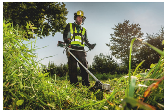
Corte potente mesmo nas aplicações mais exigentes com a nova roçadora FSB 36-18 LTX BL 40.

As três ferramentas aumentam assim a gama de 18 Volt da Metabo e o sistema de troca de baterias entre fabricantes CAS (Cordless Alliance System), atualmente com mais de 280 ferramentas de 25 marcas compatíveis com uma bateria. Para os utilizadores isto traduz-se na facilidade de ter apenas uma bateria não só para o jardim, mas também para as suas restantes ferramentas elétricas.