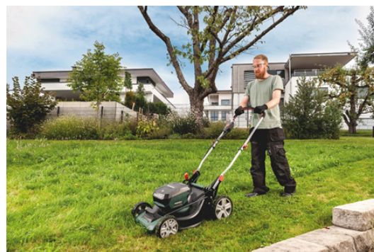
O novo potente corta-relvas RM 36-18 LTX BL 46 da Metabo é particularmente adequado para áreas amplas até 800 m 2 .

Para facilitar o transporte do corta-relvas para o local de trabalho, este está equipado com um punho duplo dobrável e com pegadas de transporte adicionais. Pode ser armazenado na vertical, ocupando assim pouco espaço.