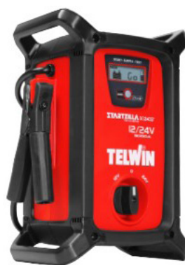
Startzilla 9024 XT 12V/24V - 9000A Start max