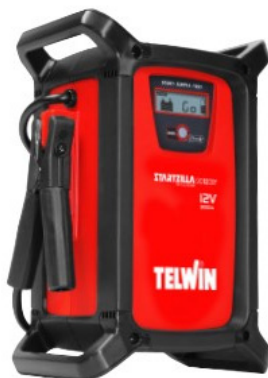
Startzilla 9012 XT 12V - 9000A Start max